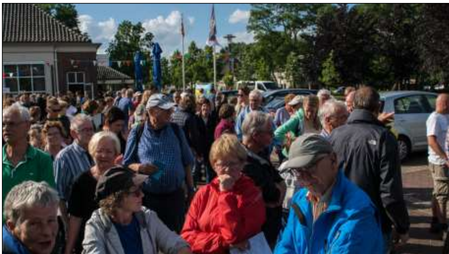
Klaar voor de start

Onder de deelnemers begroeten we OLAT-collega's uit Oirschot, bekend van de wandelgroep Oirschot, welke daar elke woensdagavond een tocht organiseert. Overigens komt een groot gedeelte van onze vrijwilligers uit de