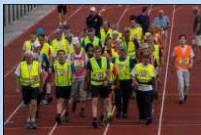
IWE: verslag van het Internationale Wandel Evenement in Weert