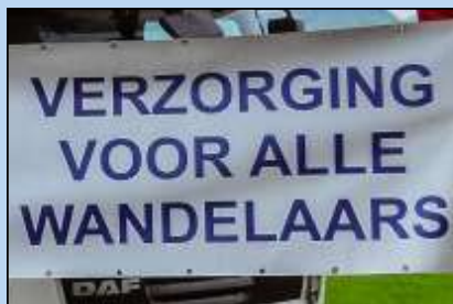
Nijmeegse Vierdaagse: OLAT- verzorging voor alle wandelaars