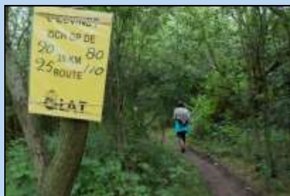
OLAT Wandeldagen / Nacht van OLAT: een vooruitblik